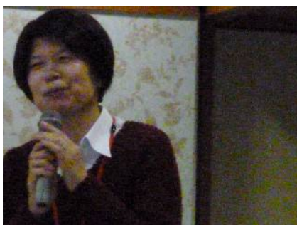
挨拶する立田女子部長

研修会には、各店舗の勤怠担当の事務員さんと、本部で働く事務員さん、それに組合三役の総勢32名が参加。